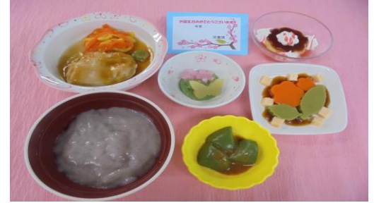
3/25 お誕生日メニュー