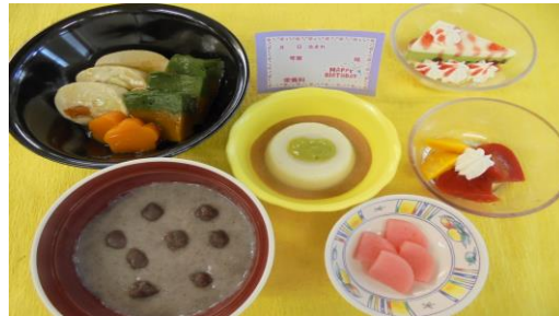
4/15 お誕生日メニュー