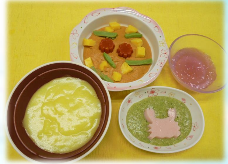
☆ターメリックライス☆